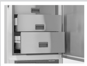
Innenausstattung Edelstahl-Schubfächer mit Kälteblenden.