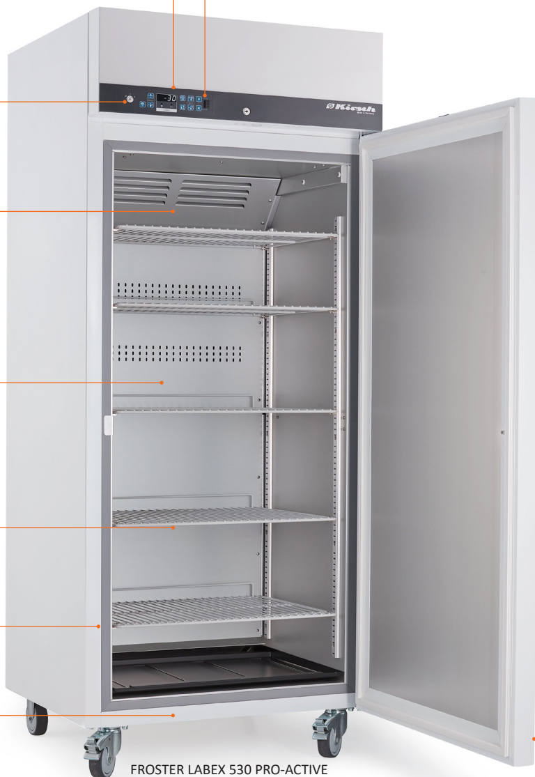
FROSTER LABEX 530 PRO-ACTIVE

Potentialfreier Kontakt/ RJ 45 Buchse bei optionalem PC-KIT-NET