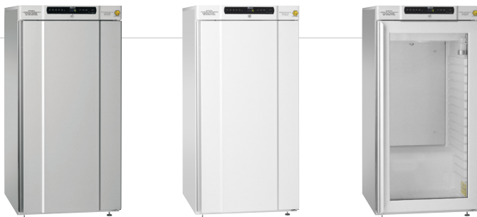
Geräte aus der Serie BioCompact II 310 sind als Kühl- oder Tiefkühlschränke in weiß lackiertem Stahlblech oder in Edelstahl erhältlich. Wählen Sie zwischen isolierter Glastür mit integriertem Licht (RR) oder massiver Tür.

Diese Baureihe ist ebenfalls zur Lagerung von Medikamenten sowie Impfstoffen konzipiert. Die Modellserie kann optional nach den Anforderungen der DIN 58345 ausgestattet werden.