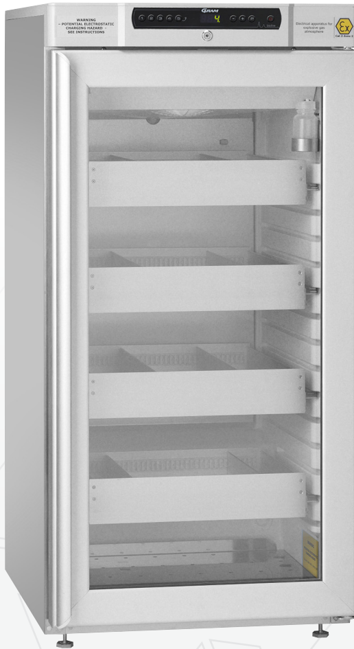
BioCompact II RR310. Schubladen und Glastür als stehen als optionales Zubehör zur Verfügung.

Der BioCompact II 310 ist ein Kühl- oder Tiefkühlschrank in intermediate Größe.